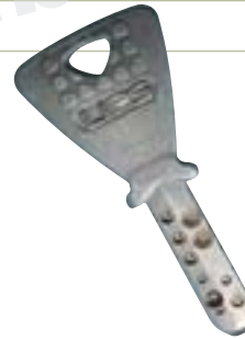
Sleutel met putjes (dimple-sleutel)